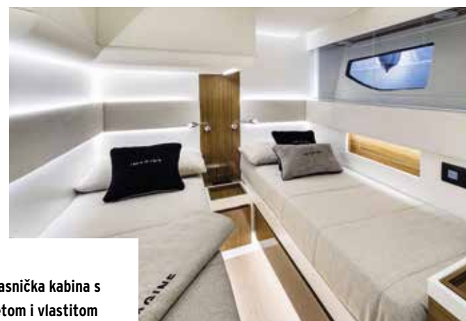
U pramcu je vlasnička kabina s bračnim krevetom i vlastitom kupaonicom, dok su na krmenom dijelu dvije gostinske kabine, svaka s dva pojedinačna kreveta